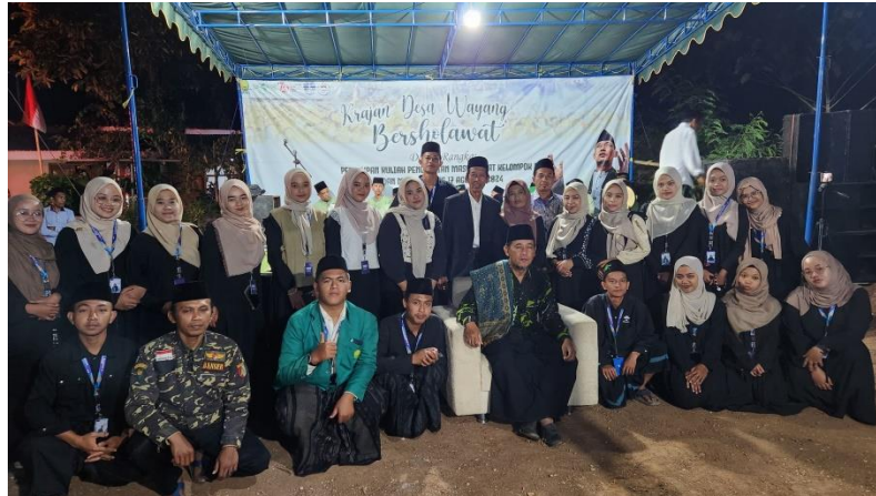
Gambar 3. Pelaksanaan Kegiatan Pengajian sebagai Puncak Acara Festival Gebyar Muharram

Sebagai akhir dari tahapan pendekatan ABCD adalah reflection . Pada tahapan ini dilakukan evaluasi dengan melakukan validasi kepada pihak-pihak yang terkait dengan kegiatan Festival Gebyar Muharram ini, diantaranya anak-anak yang mengikuti lomba, pihak sekolah, orang tua anak, dan masyarakat Desa Wayang. Respon dari anak-anak menunjukkan bahwa setelah kegiatan ini dilaksanakan, anak-anak mampu menumbuhkan jiwa semangat dan percaya diri serta mampu berkompetitif dengan baik. Hal ini sesuai dengan pengabdian yang pernah dilakukan oleh Nisa & Zunairoh (2022) bahwa dengan pelaksanaan lomba pada anak dapat meningkatkan rasa percaya diri interpersonal skill pada anak. Pihak sekolah dan orang tua juga merasa senang dengan kegiatan ini karena anak-anak dapat menyalurkan minat dan bakatnya melalui wadah pendampingan dan perlombaan. Namun, optimalisasi minat bakat anak ini tentu perlu mendapatkan dukungan dari berbagai pihak, diantaranya orang tua dan pihak sekolah dengan cara mengajak diskusi dan memberikan perhatian secara khusus terkait minat bakat yang dimiliki oleh anak (Prasmasiwi & Hidayat, 2022). Selain itu, kegiatan puncak dari Festival Gebyar Muharram yaitu pengajian juga mendapatkan apresiasi yang baik dari masyarakat sekitar, bahwa kegiatan ini mampu meningkatkan rasa religiusitas bagi warga Desa Wayang.