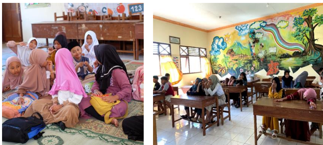
Gambar 2. Pelaksanaan Kegiatan Lomba Minat Bakat Anak sebagai Serangkaian kegiatan Festival Gebyar Muharram

Hasil dari pendampingan optimalisasi minat bakat, tim pengabdian masyarakat melaksanakan kegiatan lomba yang bertujuan untuk meningkatkan jiwa kompetitif anak dan memberikan apresiasi atas keikutsertaan anak dalam mengembangkan minat dan bakat. Selain itu, dengan diadakannya kegiatan lomba dapat meningkatkan pembelajaran bagi anak untuk belajar mengontrol emosi (Fadlillah, 2019). Kegiatan lomba minat dan bakat anak yang merupakan serangkaian Festival Gebyar Muharram di Desa Wayang dilaksanakan pada tanggal 4 Agustus 2024 yang bertempat di SDN Wayang. Adapun penentuan lokasi di SDN Wayang ini selain karena letaknya yang strategis di Desa Wayang sehingga dapat dengan mudah diakses oleh warga dan tim pengabdian masyarakat, penentuan lokasi ini juga bertujuan agar menarik perhatian masyarakat terhadap SDN Wayang. Kegiatan ini menggunakan beberapa ruang di SDN Wayang meliputi Masjid, ruang kelas 1, ruang kelas 5, dan ruang kelas 6.