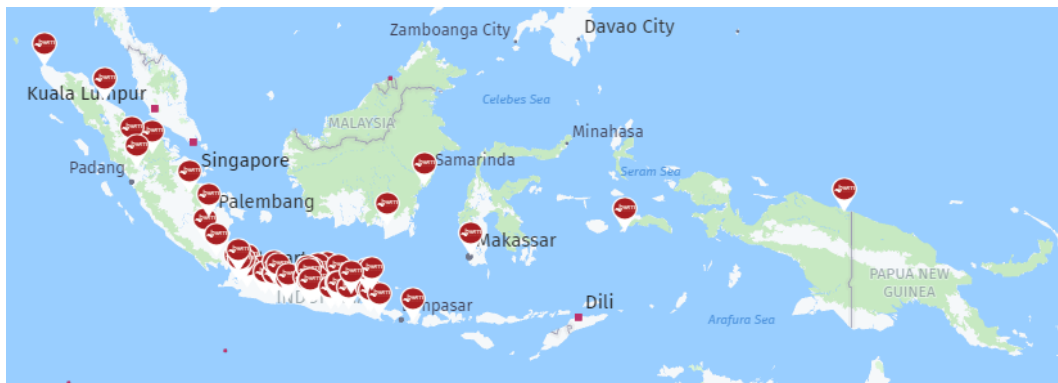
Gambar 1 Peta Persebaran BWM

meminjam yang sangat rumit. BWM melindungi komunitas kecil dan merupakan solusi tanpa pemberi pinjaman bagi komunitas kecil untuk mengakses pembiayaan. Pondok Pesantren dijadikan sebagai lembaga yang potensial bagi masyarakat, selain sebagai lembaga pendidikan Islam, tetapi juga sebagai lembaga peningkatan kapasitas. Partisipasi aktif pondok pesantren dalam pemberdayaan masyarakat merupakan komitmen pondok pesantren terhadap masyarakat lingkungan pondok pesantren untuk meningkatkan perekonomian masyarakat, baik individu maupun kelompok (Disemadi & Roisah, 2019).